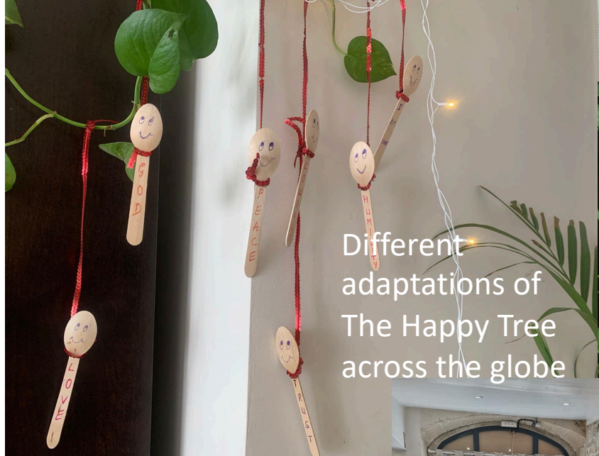
Different adaptations of The Happy Tree across the globe