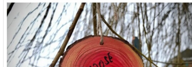
Close-up of a wooden plaque hanging from the tree.

A series of wooden plaques were created containing positive messages of hope. Using string the plaques were hung on the willow tree in Ekta's front garden. The people who walk by read the messages on the tree and it revives their hope. Many of those who were walking by with a frown engrossed in thoughts decide to stop, smile and hug the tree.